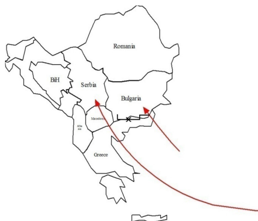
Слика 4 Мигрантски рути на Балканот во 2015 година

Мигрантската криза предизвика најголем притисок на македонските граници во текот на 2015 година. Неконтролираните бранови мигранти, кои во текот на летниот период достигнуваа од 5.000 до 10.000 лица на ден на јужната граница ја издигнаа потребата од активирање на системот на кризен менаџмент во Република Македонија. Преминувањето на повеќе од половина милион лица низ територијата на земјава неминовно влијае на зголемување на безбедносните ризици, и тоа не само на илегална миграција туку и шверц, користење на рутата за транспорт на лица со намера да извршат терористички напади на европска почва, како и превоз на борци-повратници од боиштата во Сирија и Ирак. Македонските власти поради овие причини и заради полесен транзит на овие лица низ македонска територија, водејќи се од хуман аспект издадоа документ што им овозможува на бегалците транзит за 72 часа. Како одговор на тоа, Унгарија, Словенија и Хрватска почнаа да градат нови огради што ги принудија мигрантите да ги променат правците, но исто така, и начинот на кој тие ќе влезат во земјите, бидејќи нивната крајна дестинација се земјите како Германија или Шведска. Македонската граница е една од главните точки за движење на мигрантските рути и одбивање на лажните баратели на азил (слика 11).