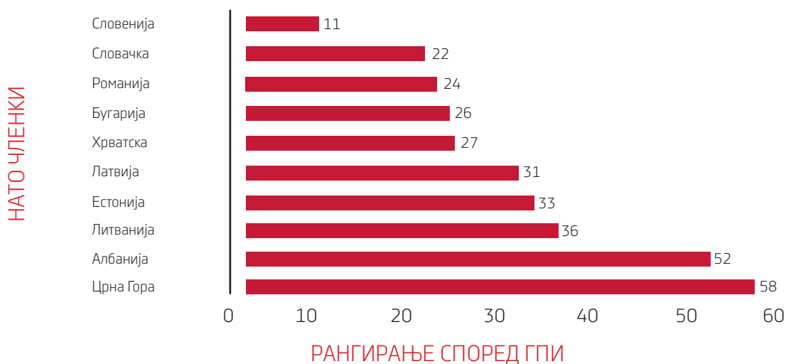
Слика 2 Земји што последни пристапиле во НАТО (2004-2017) и нивното ГПИ глобално позиционирање во 2018 година

Земја што е рангирана како најмирна во светот е Исланд, по што следуваат земји како Нов Зеланд, Португалија, Австрија и Данска. Глобалниот индекс на мирот во 2018 85 година открива дека мирот има значително влијание врз макроекономските перформанси. Во последните 70 години, порастот по глава на жител е трипати поголем во многу помирољубивите земји, кога се споредува со земјите со релативно ниско ниво на мир. Разликата е уште посилна кога се гледаат промени во мирот, при што извештајот откри дека порастот на БДП по глава на жител е до седум пати поголем во последната деценија во земјите што се подобрија во мир, наспроти оние што се влошија.