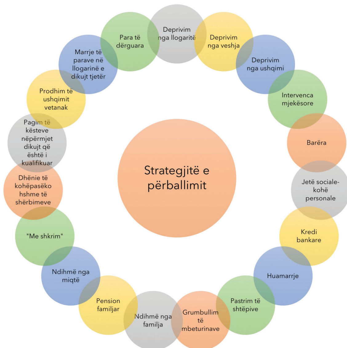
Imazhi Nr.2 Strategjitë e përballimit të të intervistuarve

Shteti duhet parë këtë dhe duhet pranuar këtë [...] dhe duhet të më ndihmojë të krijoj kushte më të mira për fëmijët e mi. Por ata nuk bëjnë këtë.” Lutvija