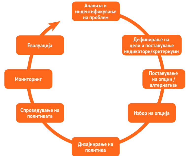
Дијаграм 1: Фази во процесот на креирање политики

Дијаграмот покажува дека мониторингот и евалуацијата претставуваат, едновременно – и завршна фаза во процесот на креирање јавни политики, и почетна фаза во креирањето нова, односно подобрување постојна, политика. Од тој аспект, мониторингот и евалуацијата претставуваат неопходна врска за применување на принципот на континуирано подобрување и континуирани промени, што е основа за квалитетот и за напредокот.